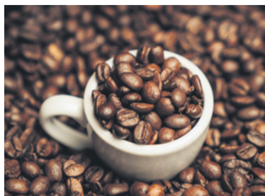
Кофе донские казаки начали употреблять еще в XVI столетии, и в каждой семье был свой рецепт его приготовления.

Сегодня кофе часто пьют с молоком или сливками, донские же казаки предпочитали молоку каймак. Это жирная топленая пленка, которая собиралась с поверхности кипяченого и остывшего