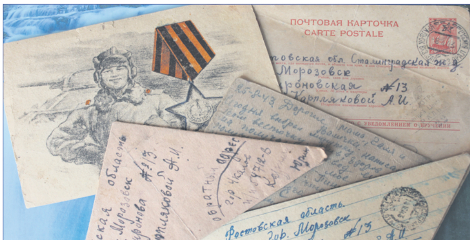
Брат В.Я.Сухиной Юрий часто писал на родину, и фронтовые треугольники до сих пор хранятся в семье.