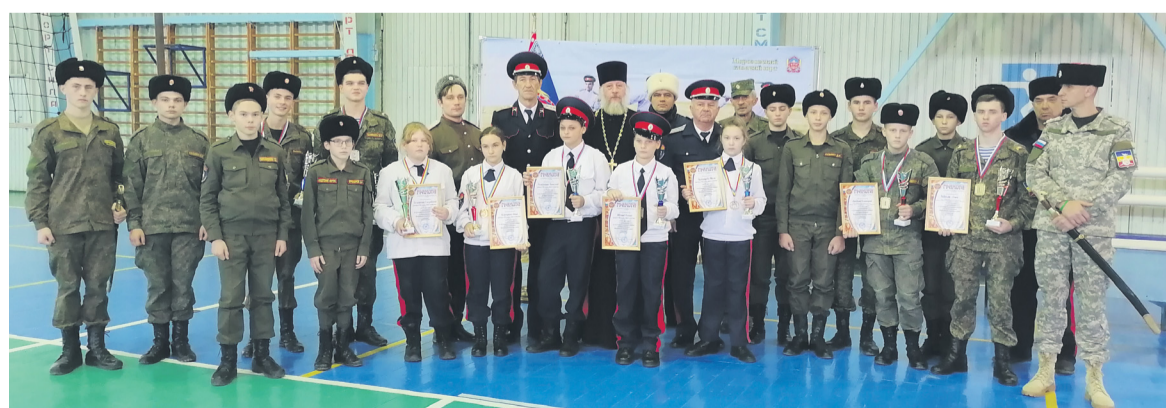
Победители и призеры соревнований награждены кубками, медалями и грамотами.