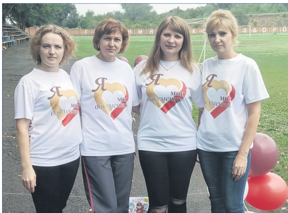
Сотрудники МФЦ ратуют за здоровый образ жизни и принимают активное участие в спортивных соревнованиях.

В сентябре - октября этого года МФЦ не остался в стороне и от проходившей в нашей стране Всероссийской переписи населения-2020: