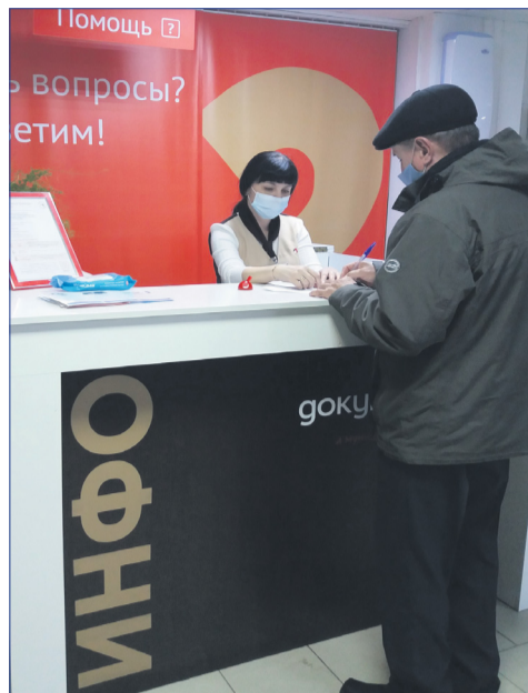
Разобраться в возникших вопросах посетителю помогут специалисты МФЦ у стойки информирования.