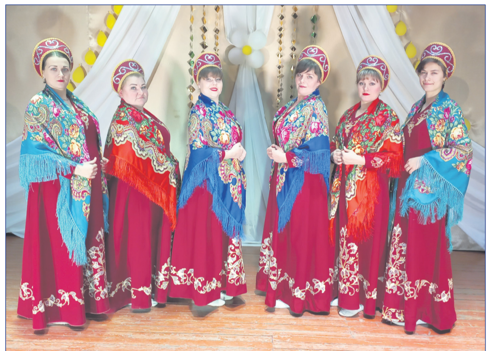
Танцевальный коллектив «Грация» в онлайн-концерте в Вознесенском СДК подарил всем мамам замечательную народную композицию.

Среди многочисленных праздников, отмечаемых в нашей стране, День матери занимает особое место. Счастье и красота материнства во все века воспевались лучшими художниками и поэтами. От того, насколько почитаема в государстве женщина, воспитывающая детей, можно определить степень культуры и благополучия общества. Счастливые дети растут в дружной семье и под опекой счастливой матери.