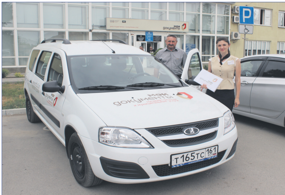
В качестве дополнительного сервиса организовано бесплатное выездное обслуживание к людям с ОВЗ и гражданам пожилого возраста, достигшим возраста 80 лет.

сотрудниками нашего центра, а также волонтерами переписи и инспектором районного уровня всем желающим посетителям оказывалась помощь в электронной переписи посредством ЕПГУ.