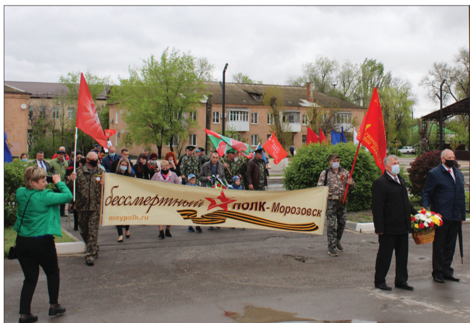
В День Победы состоялось торжественное возложение цветов к мемориалу воинам-освободителям.