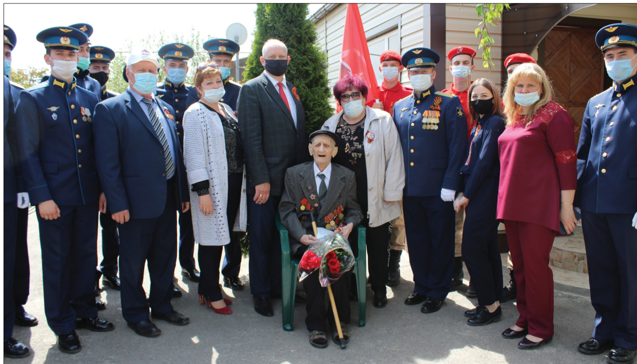
Представители местной власти, военнослужащие, юнармейцы и волонтеры в преддверии 9 Мая наведали каждого ветерана нашего города и поздравили с Великой Победой.