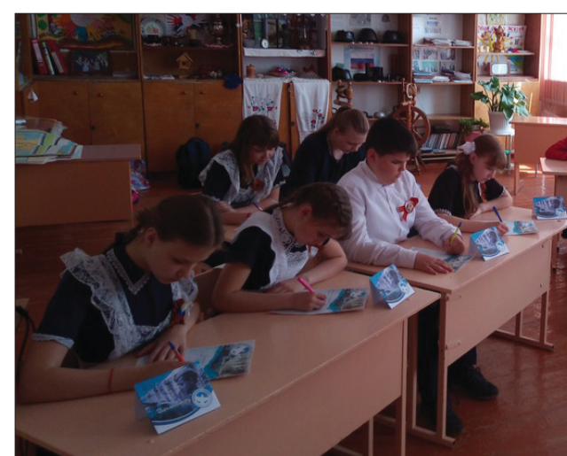
В Международном проекте «Письмо Победы», призванном сохранить память о подвиге нашего народа и отдать дань уважения ее солдатам, самое активное участие приняли обучающиеся Владимировской школы.