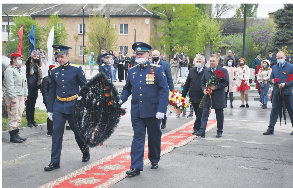
Почтив память павших Минутой молчания, собравшиеся возложили к подножию стелы венки и цветы.