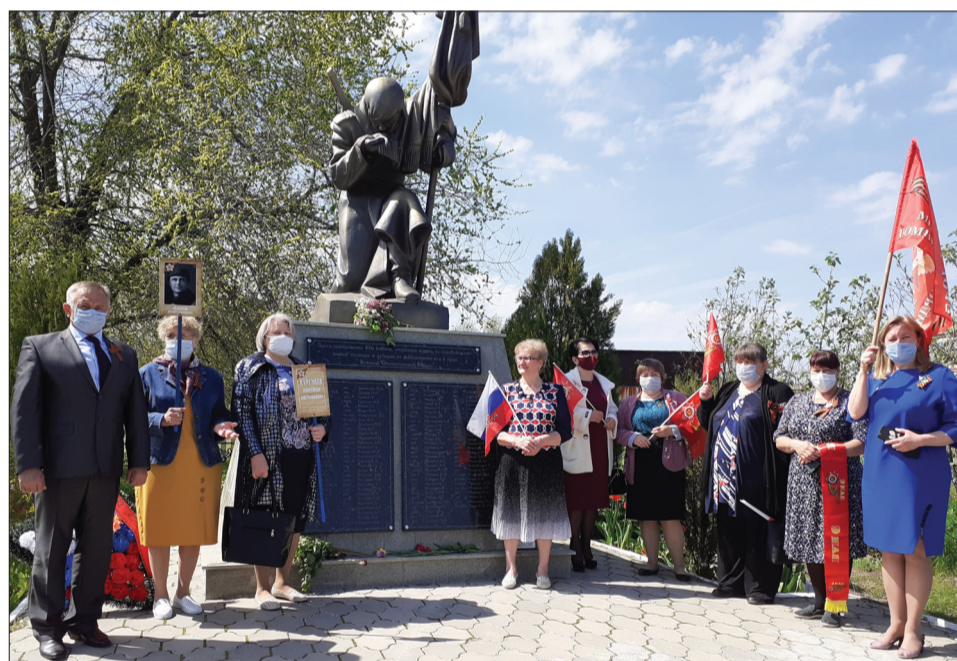
В ст.Вольно-Донской ко Дню Победы прошли митинг и церемония возложения цветов и венков к мемориалу павшим солдатам и воинскому захоронению.

Самым трогательным и поистине всенародным днем, радостным и одновременно скорбным, на протяжении десятилетий является День Победы. 9 Мая было и остается в России славной памятной датой, и никакие другие праздники не смогут сравниться с ней. В этот день по всей стране идут митинги в честь героев Великой Отечественной войны и возложения цветов к памятникам погибших.