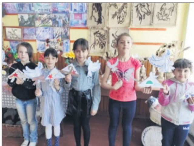
Юные вишневы - участники кружка «Умелые ручки» - под руководством культорганизатора СК Л.Ивановой присоединились к акции «Письмо солдату».

Участники кружка «Умелые ручки», который работает в Вишневском СК, присоединились к акции «Письмо солдату». На занятиях кружка под руководством культорганизатора Л.А.Ивановой дети сделали письма-треугольники, которыми пользовались солдаты с 1941 по 1945 годы, украсив их георгиевскими лентами, голубями и красными гвоздиками. Основной целью акции было привлечение коллектива и воспитанников детского сада и их родителей к изучению героической истории России, воспитание