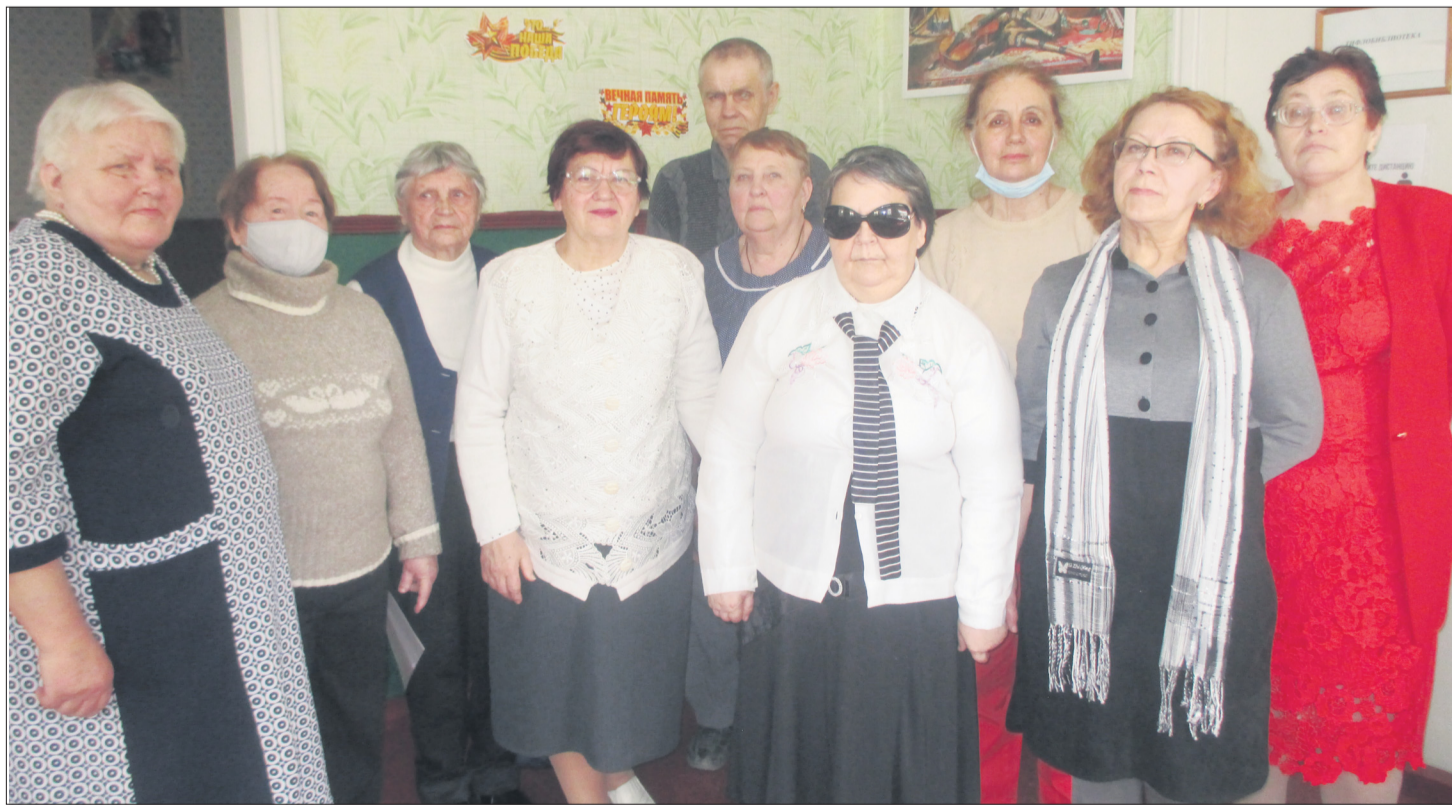
В ММО ВОС прошел конкурс чтецов «Живое слово», победители которого представят наш район на областном конкурсе.