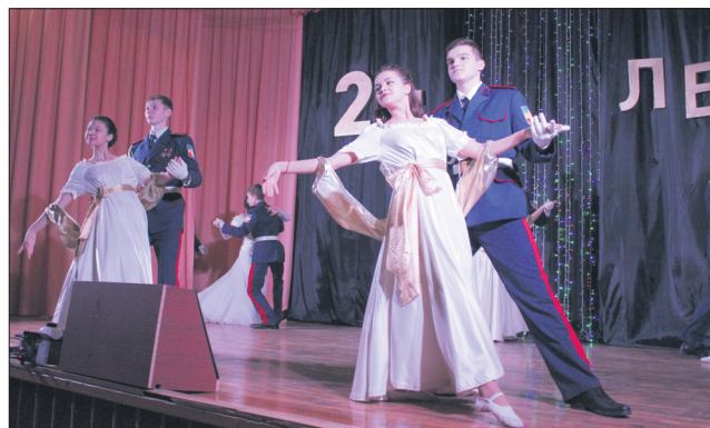
Нежным и трогательным вальсом открыл концертную программу коллектив кадетского корпуса.

Кроме того, по итогам Всероссийского конкурса на лучшие практические результаты культурно-досуговой работы учреждений культуры Российской Федерации «Золотой сокол» 60 Дом офицеров (гарнизон) награжден Дипломом первой степени за лучший аналитический обзор «Деятельность военного учреждения культуры в период пандемии коронавируса».