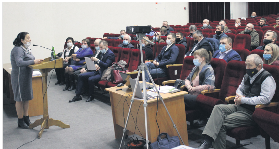
На совещании были рассмотрены самые важные вопросы проведения весенне-полевых работ в текущем году. Каждый ответ докладчика сопровождался презентацией и подробным рассказом.

Каждая тема сопровождалась подробной презентацией, в которой наглядно разбирались каждый вопрос. В завершение встречи все представители сельскохозяйственных предприятий обменялись мнениями и полученным опытом в работе.