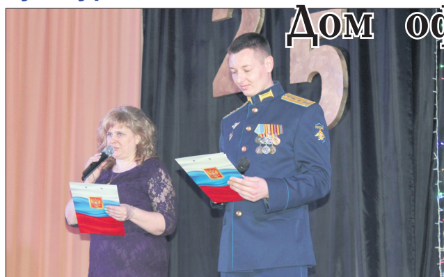
Ведущие концерта вкратце напомнили историю морозовского Гарнизонного дома офицеров.