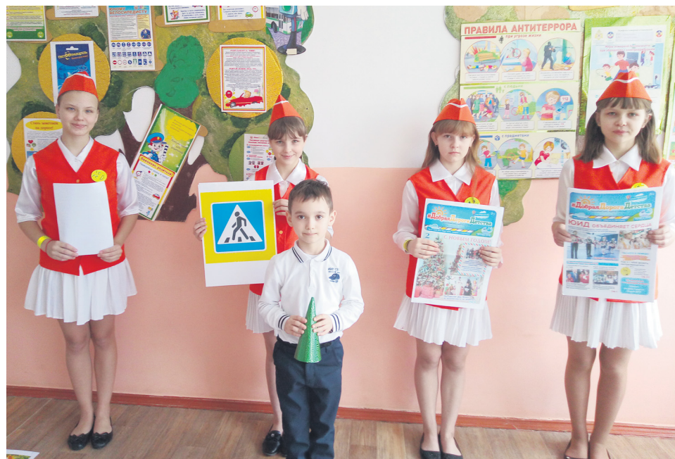
В ходе обучающей игры «Путь домой» первоклассники вспомнили правила поведения на дорогах.