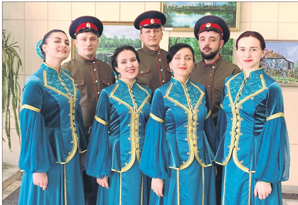
Народный фольклорный казачий ансамбль «Криница» (руководитель О.Завражина) радует поклонников искренним, чутким исполнением песен.

На сегодняшний день в РДК ведется кружковая деятельность. Не так давно заработали новые клубные формирования на безвозмездной основе: это клуб