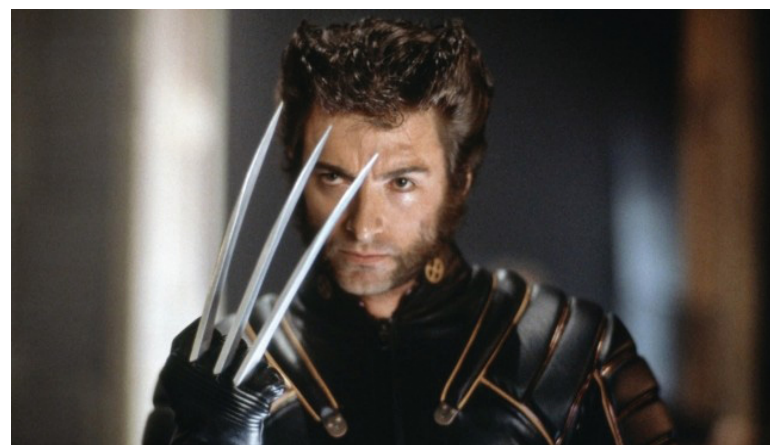
Кадр из фильма «Люди Икс». Актер Хью Джекман в роли Росомахи.

Для самого актера главной сложностью было то, что по сценарию его герою приходилось переживать массу различных эмоций, но при этом мало говорить. Чтобы вжиться в роль, Джекману пришлось вспомнить собственное детст-