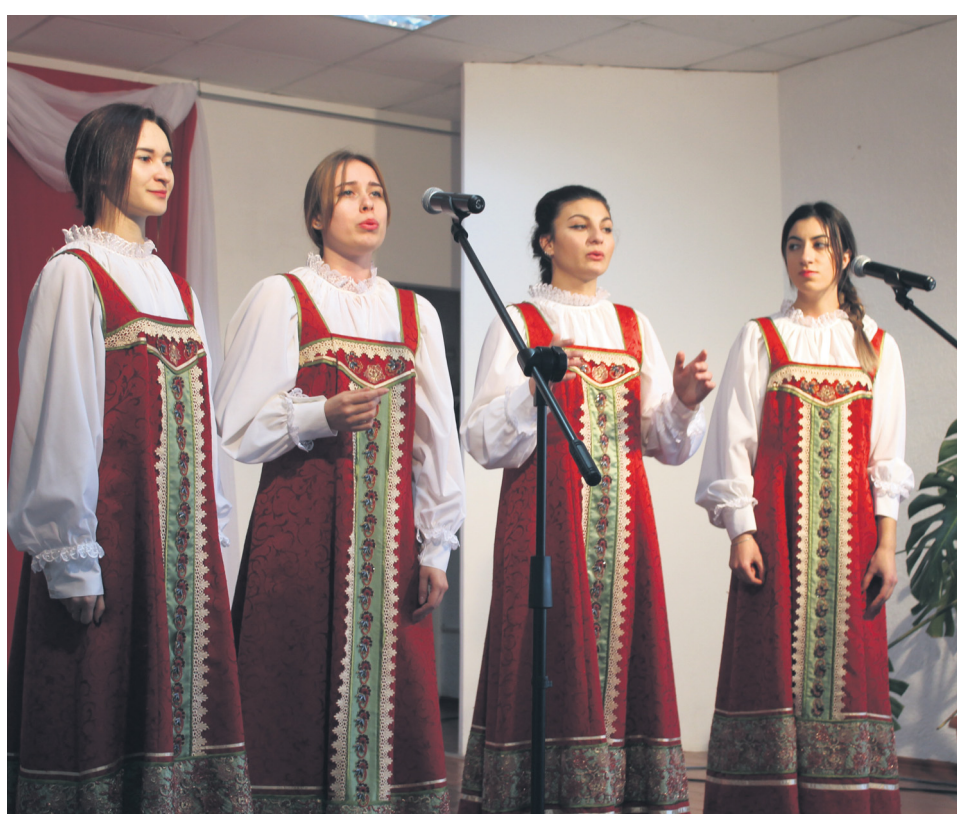
Выступление ансамбля народной песни «Славница» (руководитель Е.Галицына) на концерте, посвященном Международному дню инвалидов.