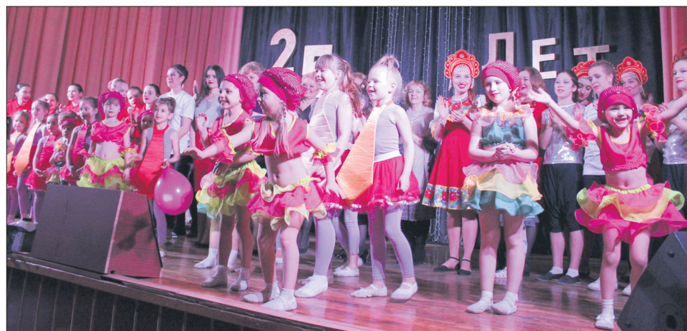
Под финальную песню на сцену вышли все участники концерта и еще раз поздравили ГДО с юбилеем.