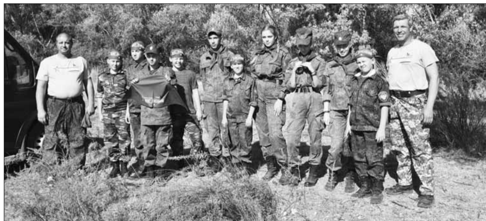
ФОТО: ЮЛИЯ ВАСИЛЕНКО.

Ребята из кадетского корпуса Белой Калитвы с радостью поучаствовали в раскопках и, получив банданы с логотипом экспедиции, вспомнили, как раньше завязывали пионерские галстуки. ФОТО: ЮЛИЯ ВАСИЛЕНКО.