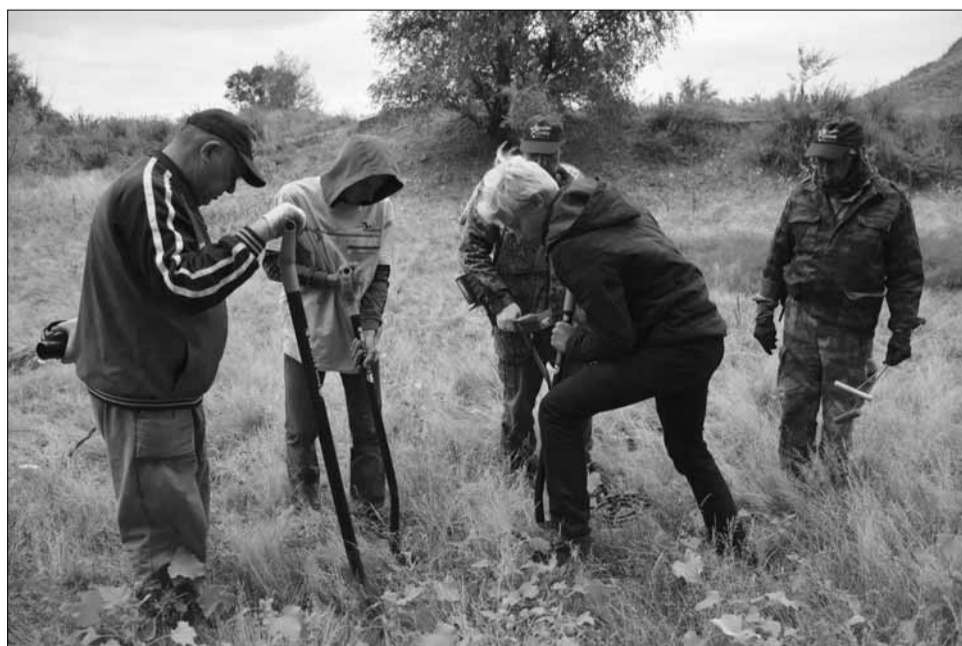
Юные жители хутора тоже не остались в стороне от раскопок: они с удовольствием приходили в лагерь каждый день и работали наравне со всеми. Молодежи не безразлично наше прошлое, а значит, и будущее в надежных руках. ФОТО: ЮЛИЯ ВАСИЛЕНКО.

И вот он - артефакт. Это достаточно старый ключ, представляющий интерес. Теперь его следует очистить от ржавчины и, возможно, удастся обнаружить клеймо, которое даст полное представление о данном предмете. ФОТО: ЮЛИЯ ВАСИЛЕНКО.