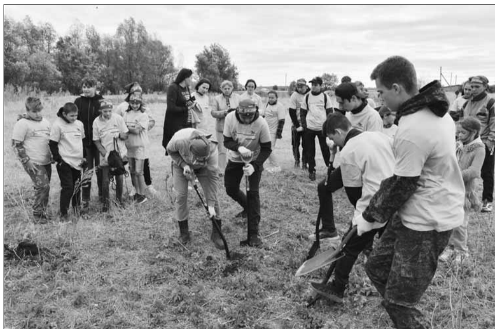
Школьники и юнармейцы также выразили желание стать участниками экспедиции. Причем не номинально - за возможность копнуть несколько раз ребята спорили между собой. Но лопаты достались всем желающим. ФОТО: ЮЛИЯ ВАСИЛЕНКО.

Дно в раскопе следует все время прощупывать: так можно определить, что именно находится под землей, какого оно размера и на какой глубине. Как только до искомого предмета остается совсем немного, начинается работа руками. ФОТО: ЮЛИЯ ВАСИЛЕНКО.