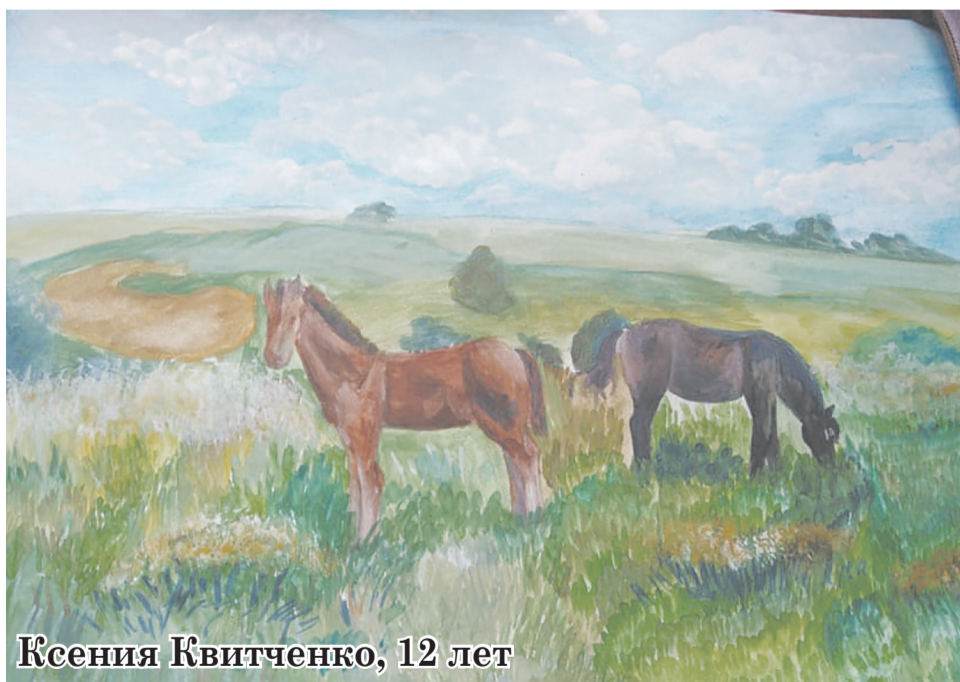
Ксения Квитченко, 12 лет

за 1 место - 3 тысячи рублей, за 2 место - 2 тысячи рублей, за 3 место - 1 тысяча рублей.