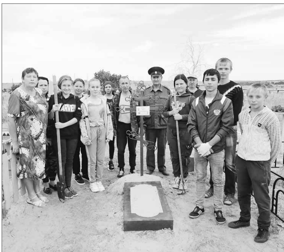
Работники Вознесенского СДК, библиотеки и Администрации Вознесенского сельского поселения присоединились к проекту «Будем помнить!» и привели в порядок могилы ветеранов Великой Отечественной войны.