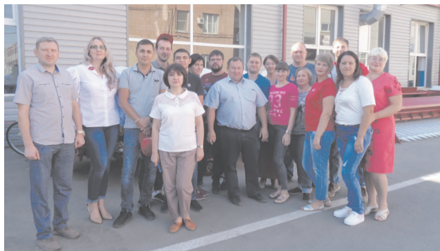
Коллектив отдела технического развития филиала АО «Клевер».

АО «Клевер» имеет широкий размах производства и является одним из градообразующих. Современное оборудование, новые технологии, высококвалифицированные специалисты делают его динамично развивающимся и успешным. Здесь каждый на своем месте, несет ответственность за свой участок и предприятие в целом, добросовестно вносит свою лепту в общее дело. И накануне профессионального праздника люди, которые приручили машины, мы побеседовали с руководителями наиболее ответственных участков завода.