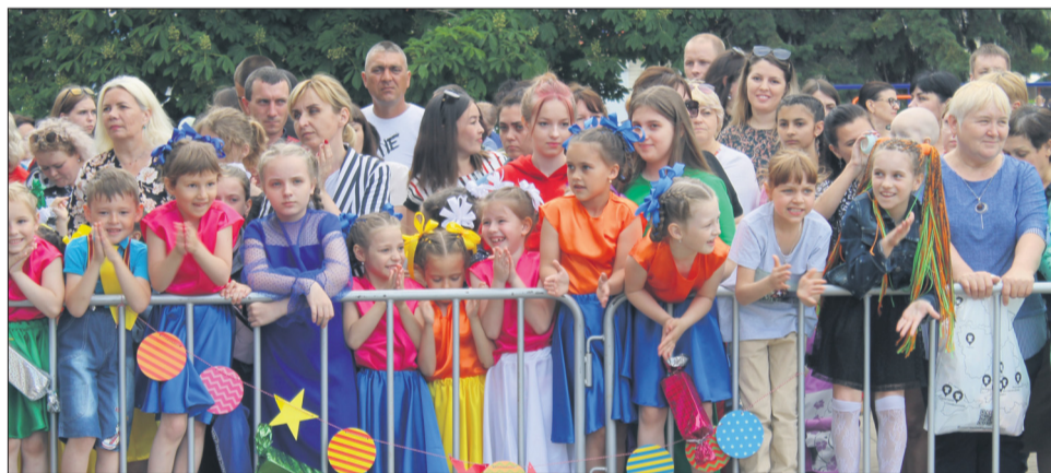
Зрителями были совсем юные мальчишки и девчонки.

Долго длился этот праздник для детей, которым в этот вечер, явно повезло с погодой. Во всяком случае, жарко не было.