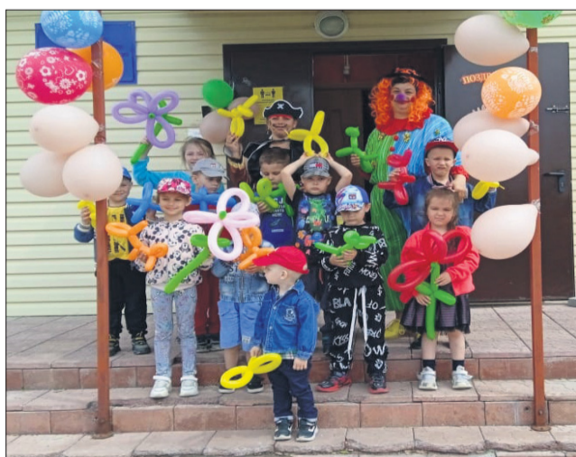
Воздушные шары, мыльные пузыри и много увлекательных игр ждали малышей из филиала детского сада «Солнышко».