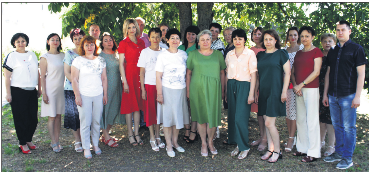
Коллектив ОСЗН Администрации Морозовского района.

Система социальной защиты населения сегодня представляет собой сеть разнопрофильных направлений, где заняты работники одной из самых сложных профессий, которая требует не только глубоких знаний, высокой квалификации, умения мобилизоваться в чрезвычайных ситуациях, но и особого душевного склада.