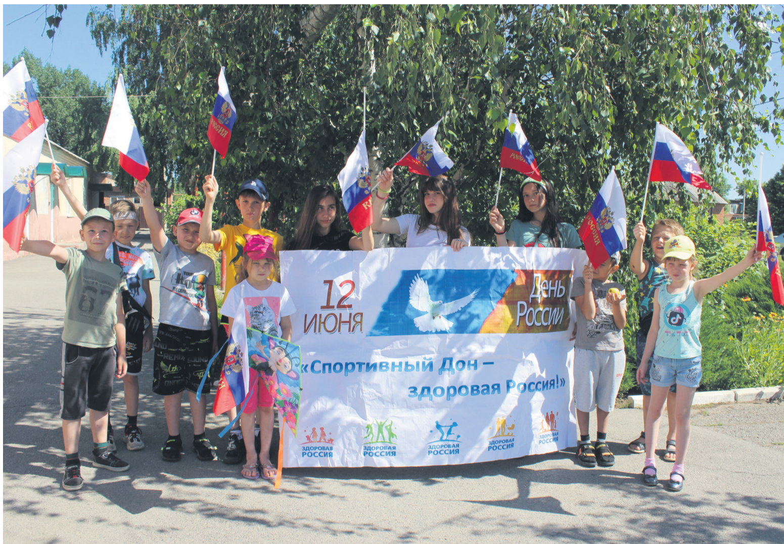
Ребята из пришкольного лагеря СОШ №3 готовятся к празднованию Дня России.