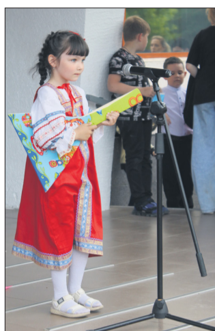
Артисты были не старше.

Невероятный по накалу веселья праздник для юных жителей Морозовска устроил 1 июня районный Дом культуры, собрав на него, опять же, невероятное количество мальчишек и девчонок - зрителей и артистов.