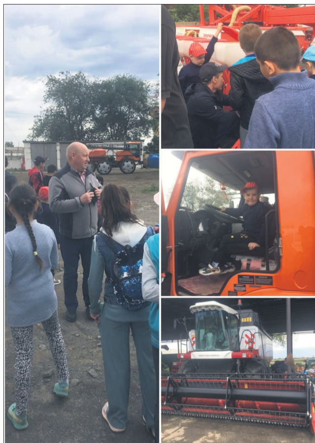
В Вишневке ребята увидели современную сельскохозяйственную технику, наблюдали, как она работает.

1 июня отмечается Всемирный праздник, направленный на улучшение благополучия несовершеннолетних, - День защиты детей. В России этот праздник проводится ежегодно: для детей организуются спортивные мероприятия, викторины, соревнования.