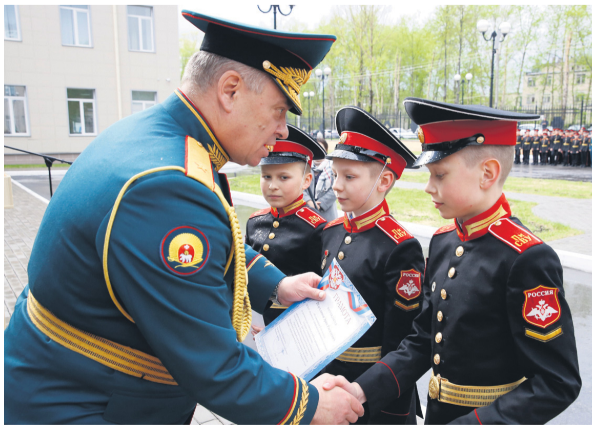
За этими мальчишками в алых погонах, уверен генерал-майор, будущее России, будущее РВСН.