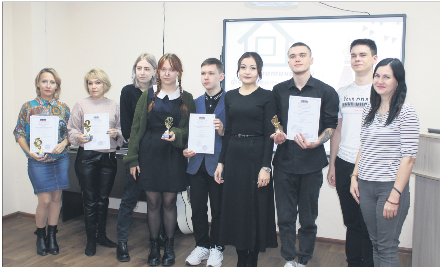
Победители фестиваля-конкурса в номинации «Видеоролик».

Так в 3-й возрастной категории в номинации «Видеоролик» победи-