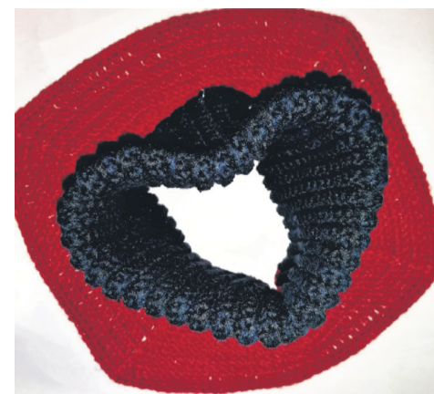
Вот такие снуды (манишки) вяжет Виктория для наших парней на передовой.

Как отмечает Виктория, на сегодня еще есть небольшой запас пряжи,