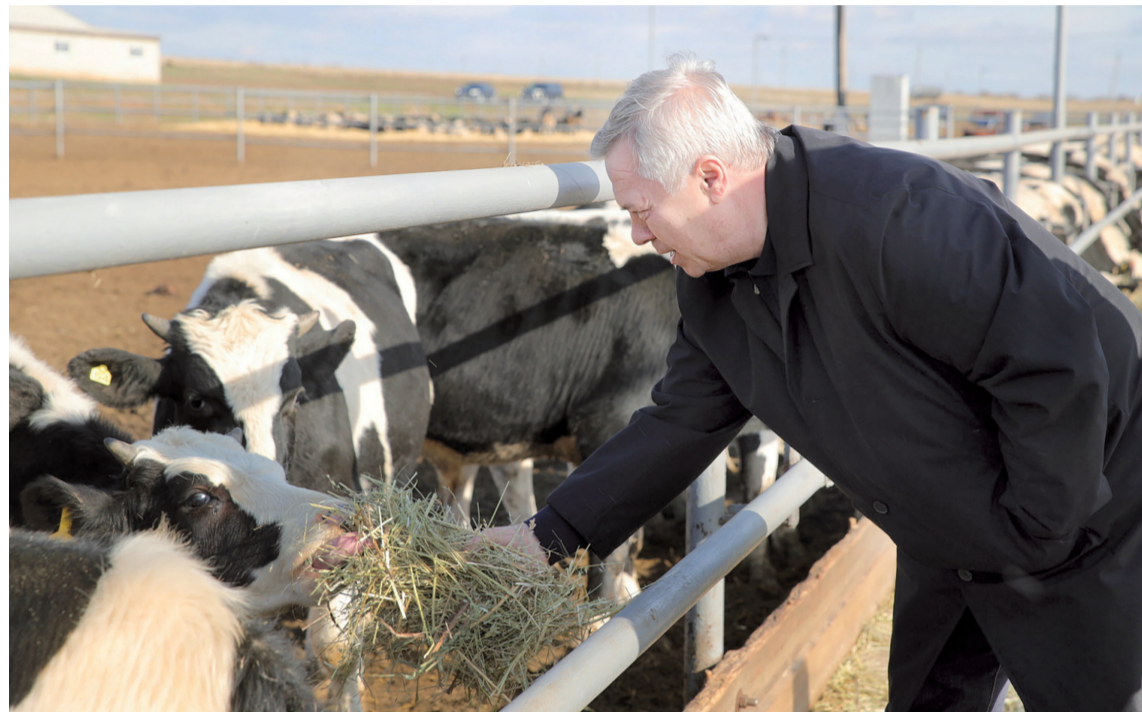
Развитие всех направлений сельского хозяйства одинаково важно для региона

– На протяжении десяти лет на эти цели направляется не