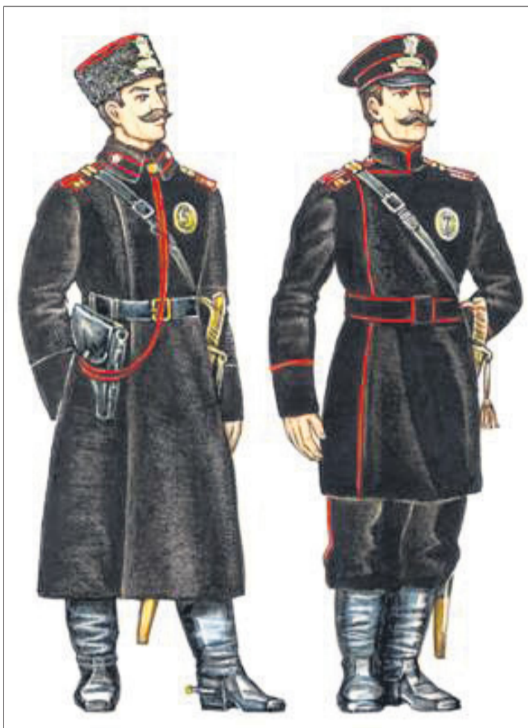
Так выглядели полицейские приставы. Цветовая гамма мундиров стражей порядка царского времени такая же, как и у современных полицейских.

Как было сказано выше, к началу XX в. на территории Донского казачьего войска сложилась довольно слаженная система реализации полицейских функций в окружной и станичной полиции. Территория юртов в